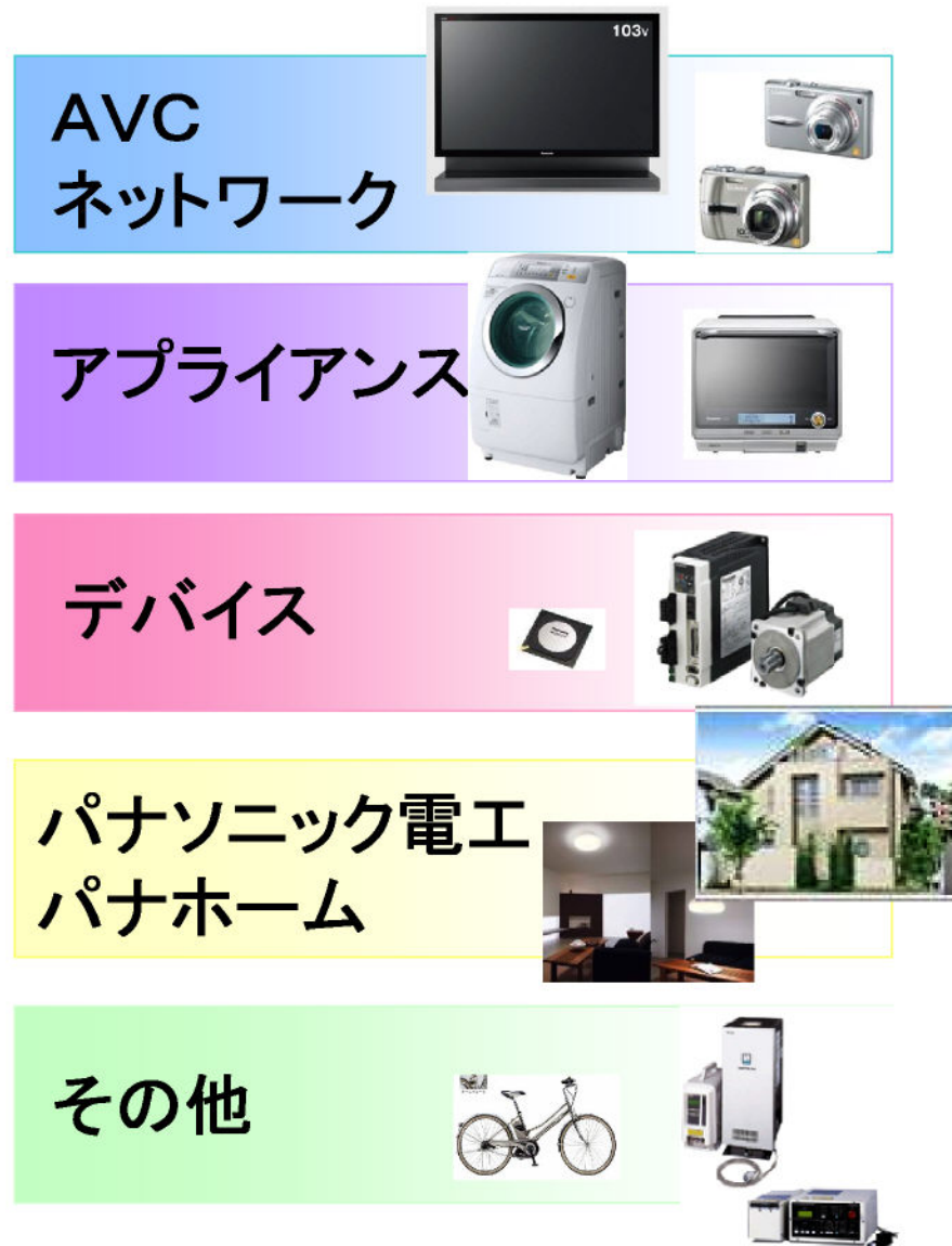
連結商品部門別売上構成比